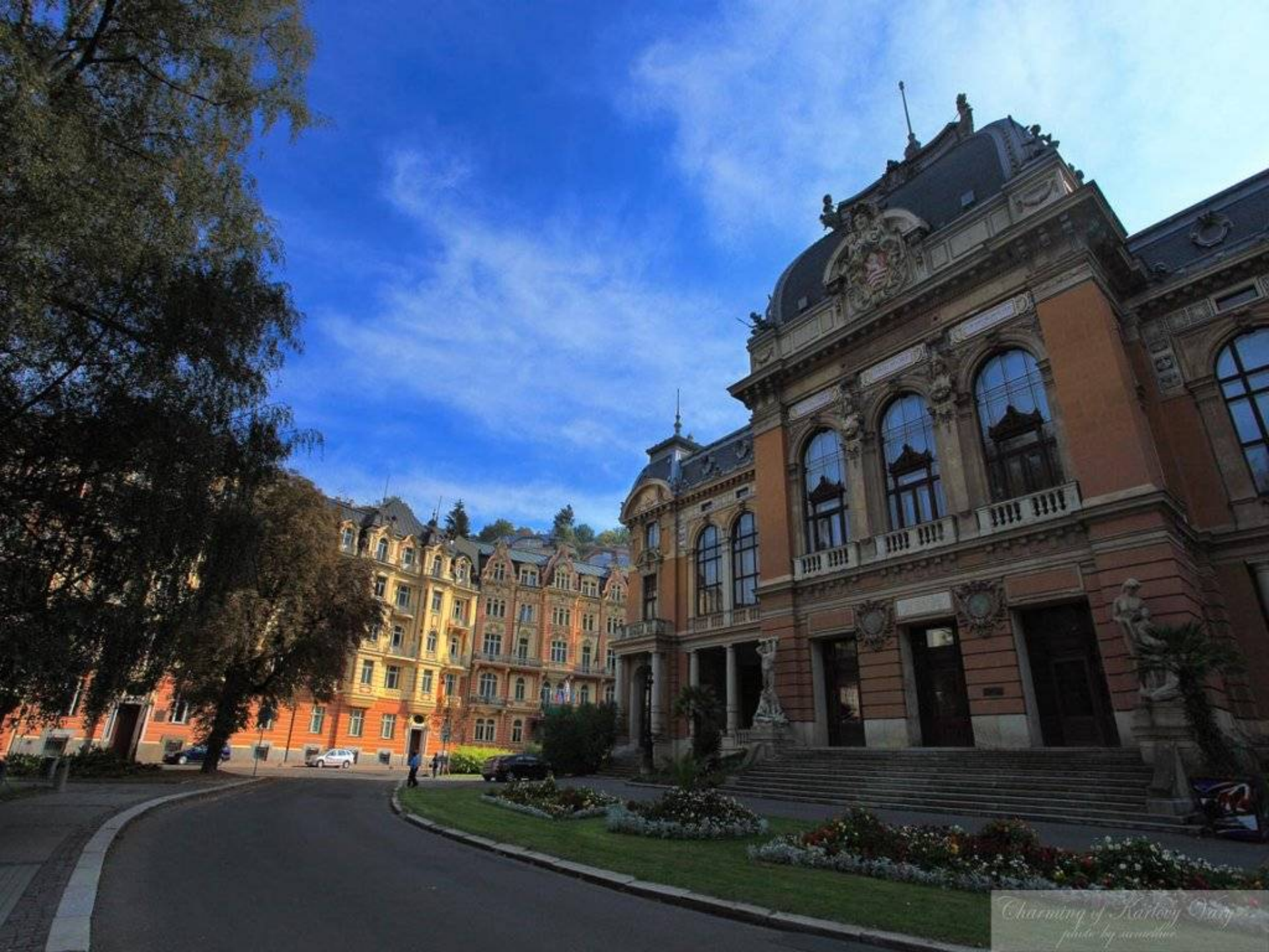
Charming of Karlovy Vary